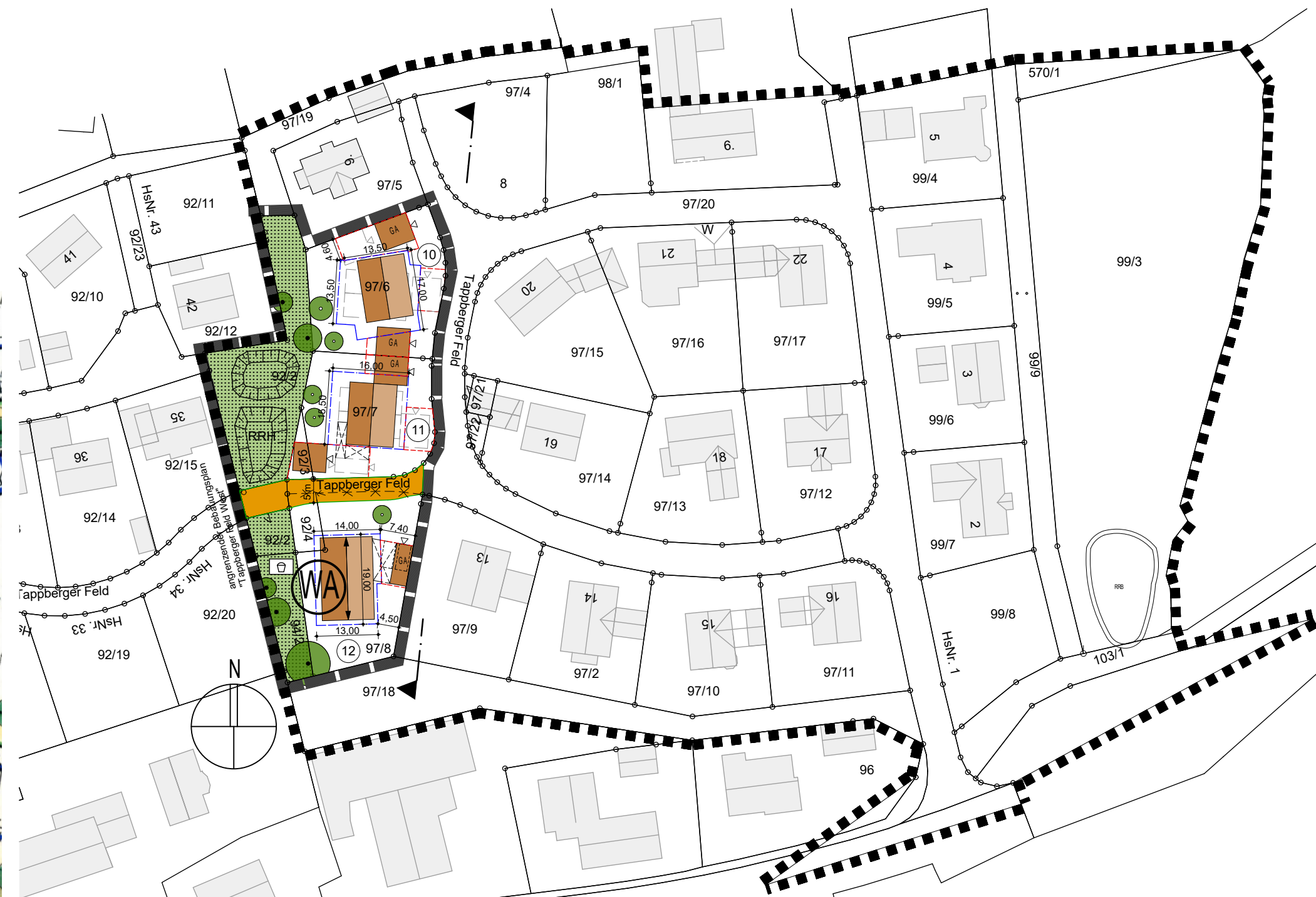
Lageplan M 1:1000 - 3.Änderung