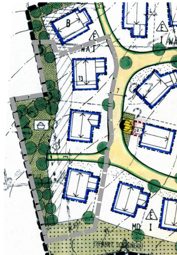
Ausschnitt BBP -Bestand