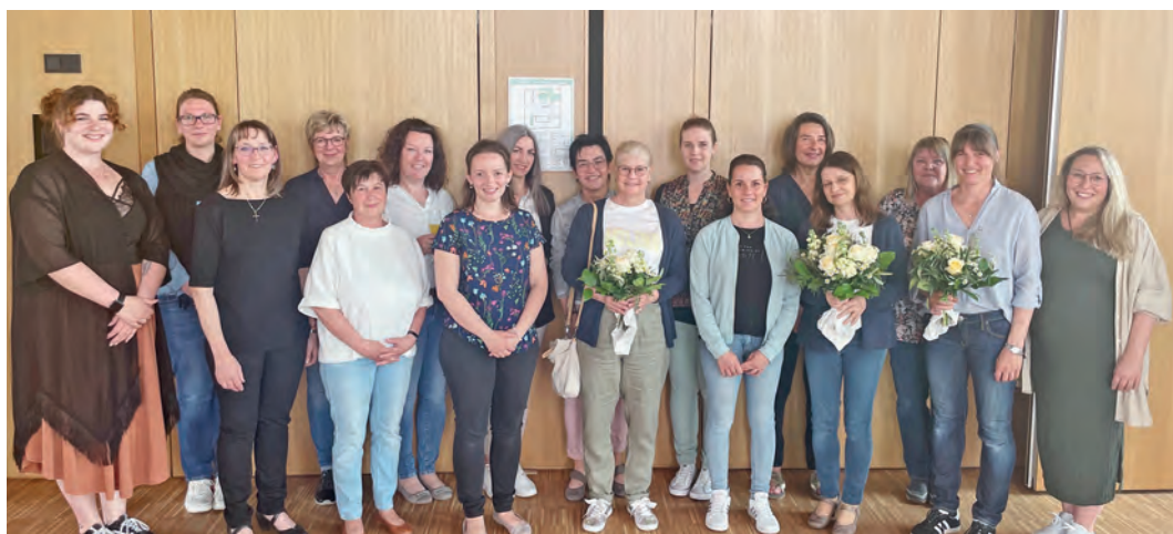
Ehrung der Mitarbeiterinnen der Kinderbetreuungseinrichtungen