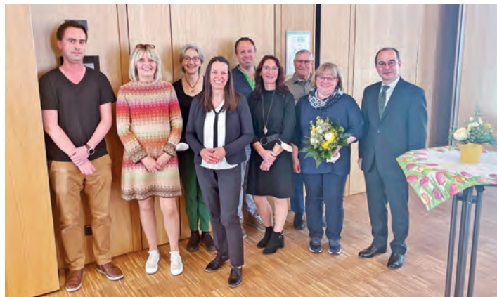
Ehrung der Mitarbeiterinnen und Mitarbeiter der Verwaltung und des städtischen Bauhofs

Bürgermeister Heinz Grundner bedankte sich herzlich für die langjährige Treue und freut sich auf die weitere gute Zusammenarbeit.