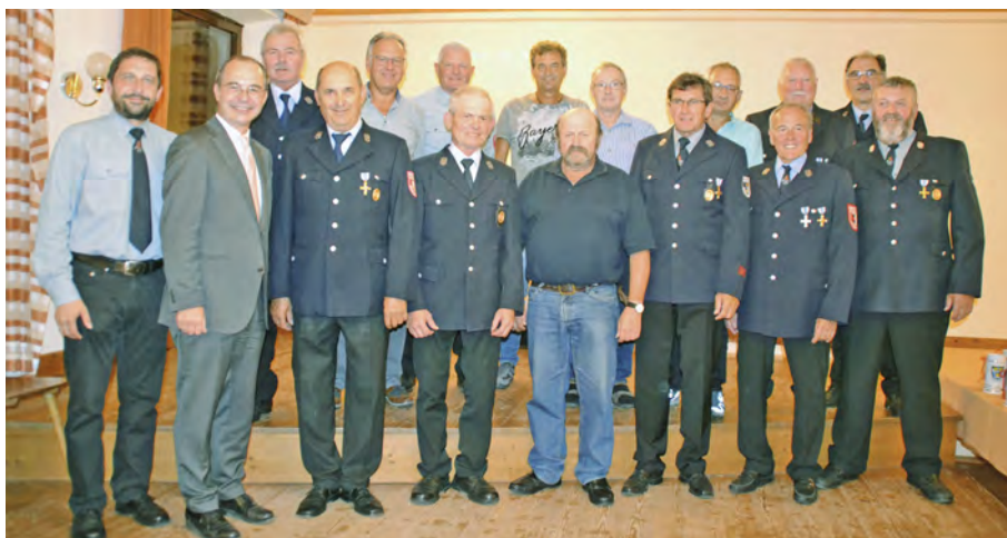
Aus dem aktiven Dienst ausgeschieden