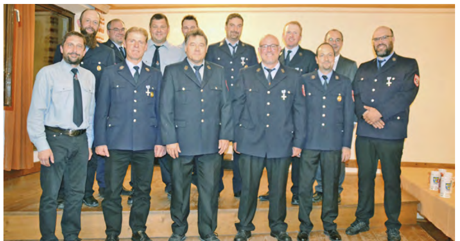
25 Jahre im Dienst