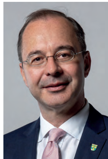
Heinz Grundner Erster Bürgermeister