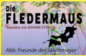
Abb: Freunde des Jakobmayer

Zum Jahreswechsel holt Opera Incognita in einer Neuinszenierung der Mutter aller Operetten, veranstaltet von den Freunden des Jakobmayer, die Leichen im Keller des gehobenen Bürgertums ans