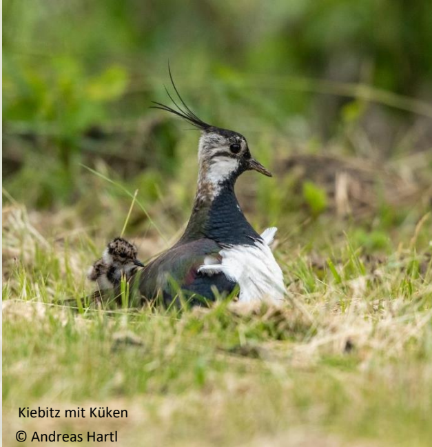
Kiebitz mit Küken