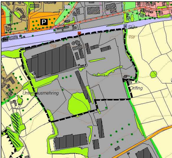
Darstellung des rechtswirksamen Flächennutzungsplanes für den Bereich „Konversion des ehemaligen Werksgeländes der Ziegelei Meindl“

Die von der 23. Änderung betroffenen Flächen sind im rechtswirksamen Flächennutzungsplan als gewerbliche Bauflächen dargestellt. Zugleich sind die im Bestand vorhandenen Gehölzflächen und Einzelbäume im Flächennutzungsplan verankert.