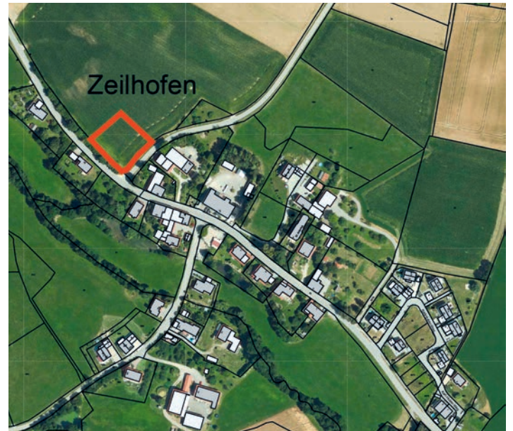
Luftbild BPL Nr. 124 Zeilhofener Feld