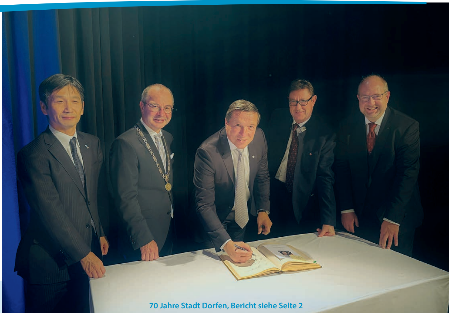
70 Jahre Stadt Dorfen, Bericht siehe Seite 2