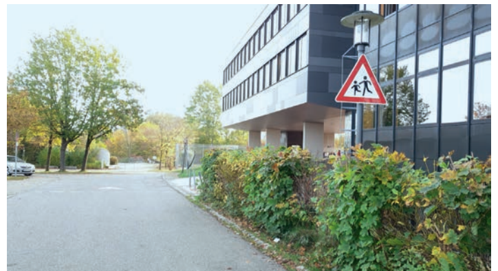
Querung zwischen Gymnasium und Förderzentrum