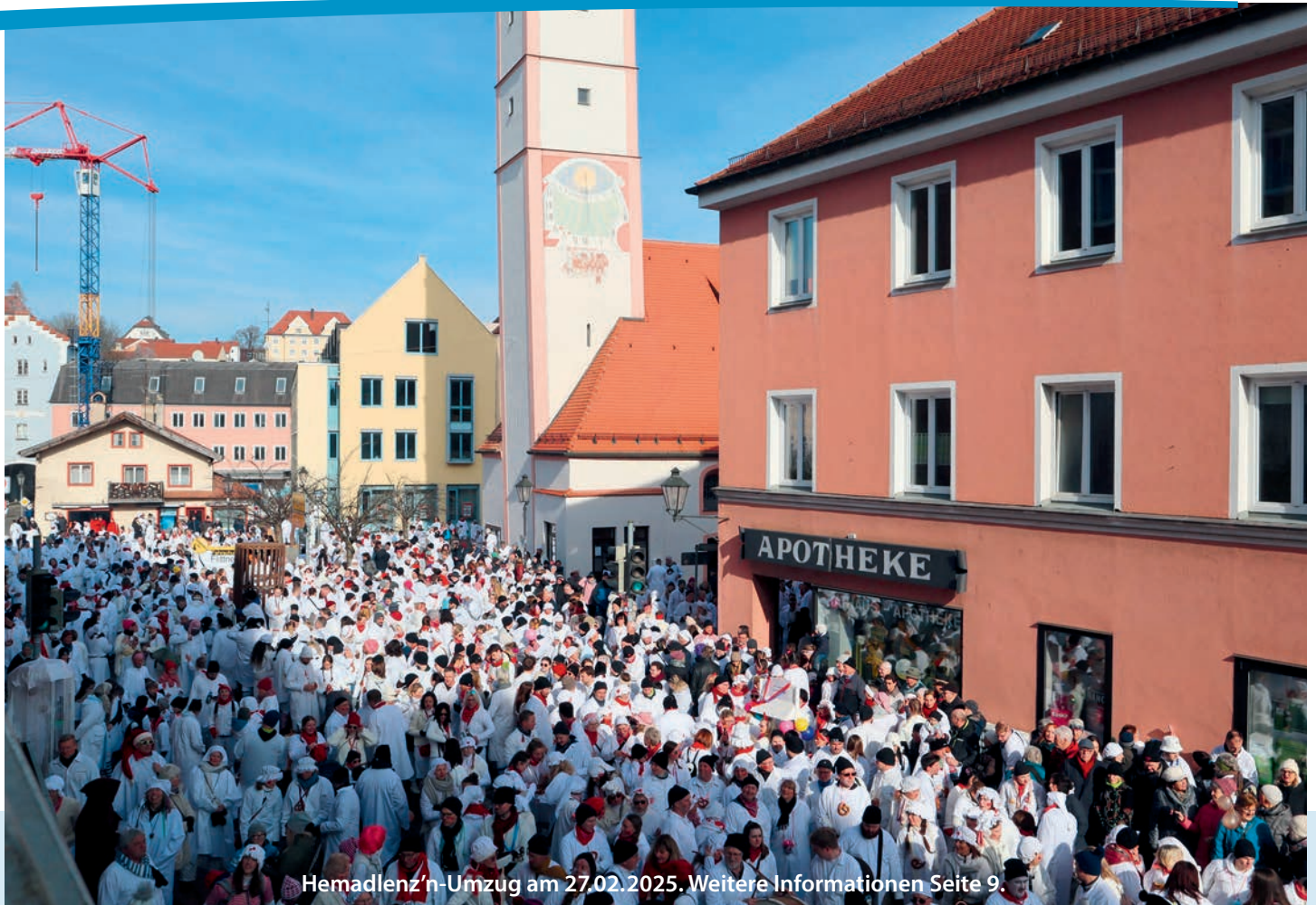
Hemadlenz'n-Umzug am 27.02.2025. Weitere Informationen Seite 9.